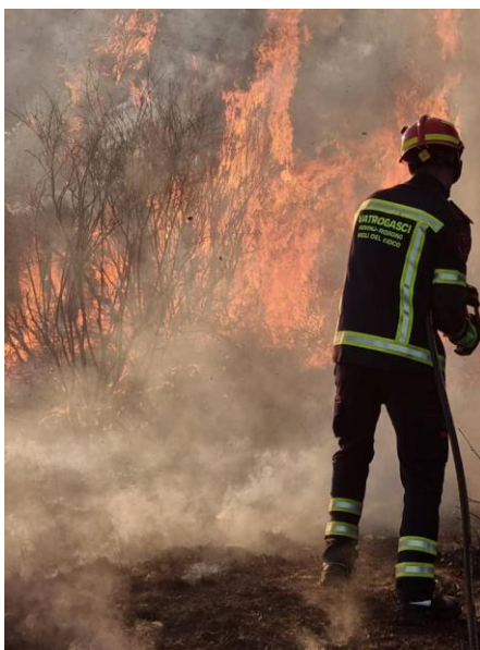
Detalji požara na području općina Bale

Ozbiljan i profesionalan pristup svakoj dojavi i intervenciji, te kvalitetna i redovita obuka profesionalaca i dobrovoljnih vatrogasaca rezultirale su izvrsnosti na samim intervencijama i daju nam za pravo da budemo glavni nosioci sustava Civilne zaštite na našem području.