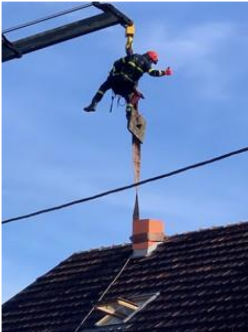
Detalj skidanja dimnjaka

vatrogastvo zahtijeva, te su stekli i neprocjenjivo iskustvo za daljnji rad i napredovanje.