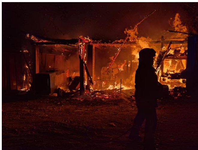
Detalji požara skladišta

dolasku nalazila u potpuno razbuktanoj fazi požara. Iako vrlo zahtjevni zbog gabarita i količine gorivog materijala i ove smo požare vrlo brzo stavili pod nadzor, lokalizirali i pogasili.